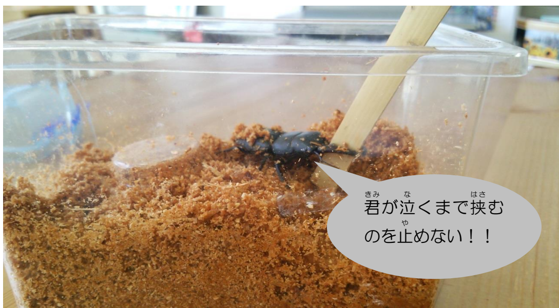
あつ ひ つづ まだまだ暑い日が続きますが、何事も粘り強く頑張りましょう(笑)

～ じぶん せいかつたの 自分 じぶん の生活 せいかつたの 楽しんで たのしみ いますか？ ～ クワガタ くわがた さんはお怒 いか りのよう よう です。